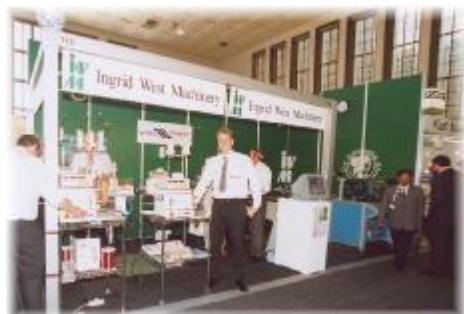
Standul IWM la CWIEME 2002 Berlin.

DE CE - Ca cea mai mare manifestatie europeana in domeniul bobinajelor, aceasta expozitie vă tine la current cu toate aspectele acestui domeniu.