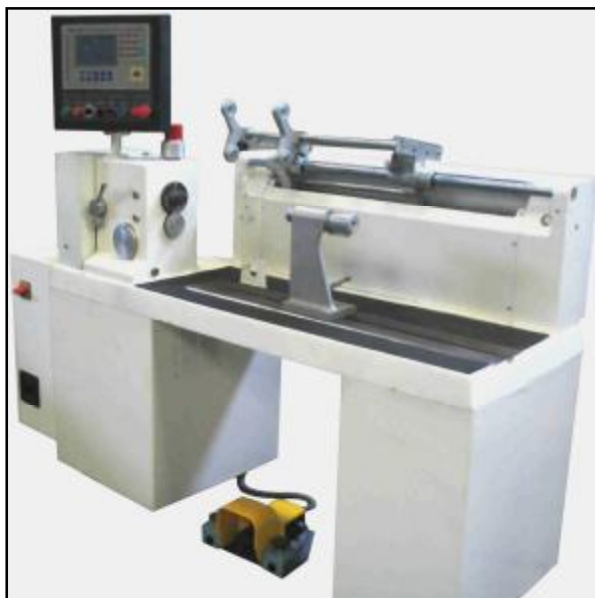
Above: A restored ER-900 Below: IWM and Erasan-Zinzo staff test a newly refurbished ER-900 machine

Oricum, functionarea corecta a acestor parti va fi verificata de tehnicienii nostri, in timpul reconstruirii masinii, si daca aceste parti vor trebui reparate sau inlocuite, clientul va fi anuntat.