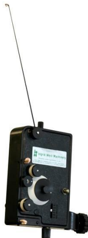
Type "TCS TCM" Drahtablauf