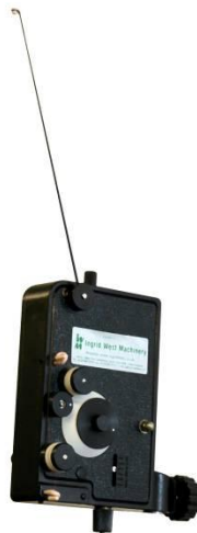
Type "TCS TCM" Drahtablauf