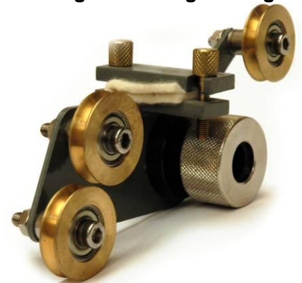
Rollerdrahtführung mit MikroEinstellung