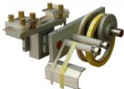
Multi-wire feeder head with margin taping