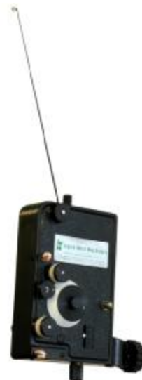
Type "TCS TCM" tensioner

Célunk, hogy többek legyünk egy gép beszállítónál. Munkatársaink nagy tapasztalattal rendelkeznek és segítséget tudnak nyújtani a tekercselés technológia valamennyi területén, a szerszám tervezéstől a gép kiválasztásáig és beüzemeléséig.