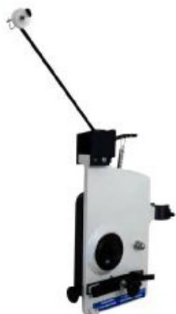
F71 fine wire tensioner