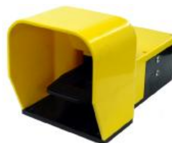
Variable speed foot pedal