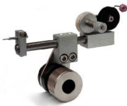
Guide tube feeder head