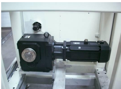
Robosztus kivitelű "Parker motor"