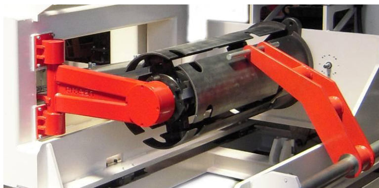
Az állítható méretű tekercstestek a megrendelő igénye szerint, a gyártandó terméknek

Célunk, hogy többek legyünk egy gép beszállítónál. Munkatársaink nagy tapasztalattal rendelkeznek és segítséget tudnak nyújtani a tekercselés technológia valamennyi területén, a szerszám tervezéstől a gép kiválasztásáig és beüzemeléséig.