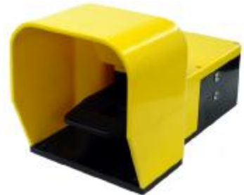
Variable speed foot pedal