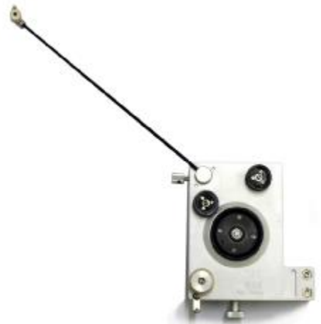
Type "A" or "B" tensioner

Naszym celem jest być kimś więcej niż tylko dostawcą maszyn. Nasz zespół posiada duże doświadczenie, a także oferuje pomoc i doradztwo związane ze wszystkimi aspektami nawijania, począwszy od projektowania urządzeń, przez dobór i uruchomieniu maszyny.