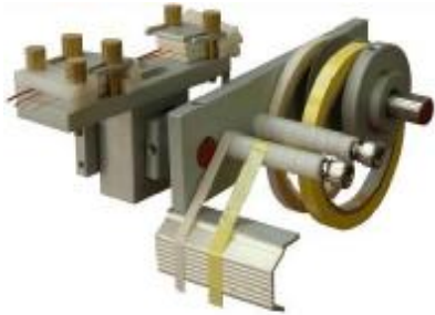
Multi-wire feeder head with margin taping