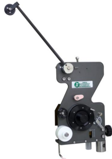
TCL heavy wire tensioner

Ne dorim sa fim mai mult decit un furnizor de masini. Echipa noastra are a vasta experienta si est dispusa sa ofere support si consultanta in taote aspectele , de la proiectarea diespzitivelor la alegerea masinilor si reglajul acestora.