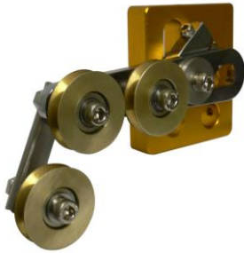
Roller feeder head