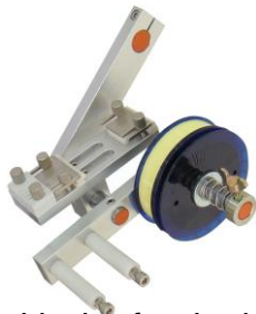
Multi wire feeder head with margin taping