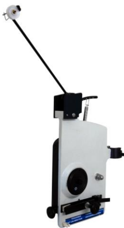
F71 Fine wire tensioner