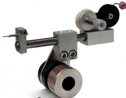
Guide tube feeder head