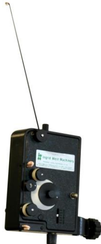
Type "TCS, TCM" tensioner