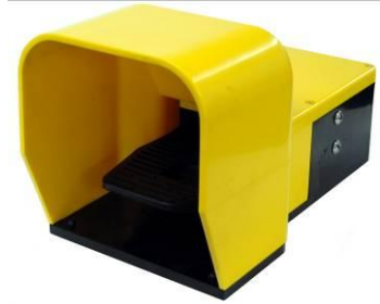
Variable speed foot pedal