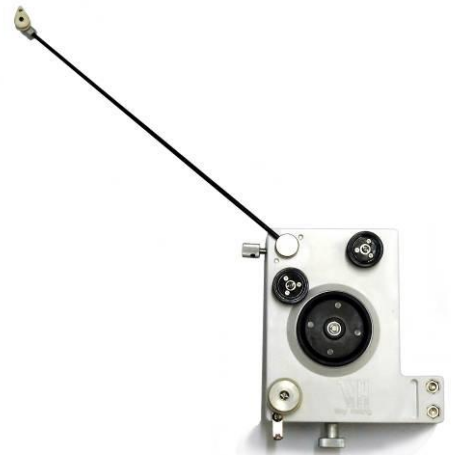
Type "A" or "B" tensioner

Nuestra meta es de ser mucho más que sólo un proveedor de maquinaria para Ustedes. Nuestro equipo tiene amplia y extensa experiencia, por lo que podemos ofrecerles nuestra ayuda y consejos sobre todos los aspectos del bobinado, desde el diseño de útiles hasta la selección de la máquina idonea y su puesta en marcha.