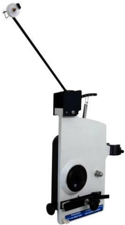
F71 fine wire tensioner