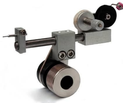
Guide tube feeder head