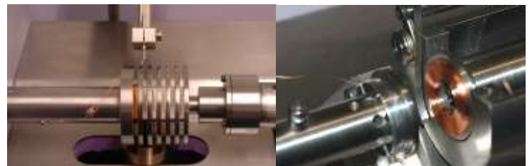
Präzisionswerkzeug kreiert präzise Spulen

Werkzeugkosten die vorab entstehen werden dem Maschinenpaket angerechnet. Wir können das Werkzeug entwickeln und fertigen einige Freigabemuster für Sie (abhängig von dem Zeitaufwand), welches ein Bestandteil des Gesamtpaketes ist.